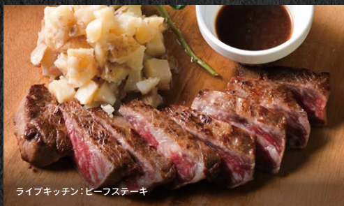
ライブキッチン: ビーフステーキ