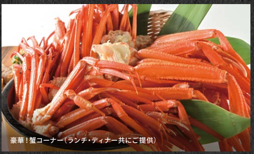
豪華! 蟹コーナー(ランチ・ディナー共にご提供)