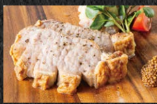
ライブキッチン: 神戸ボークステーキ

大人気の蟹コーナーはもちろん、お好きなネタで楽しめる海鮮丼や関西ご当地メニューがズラリ!